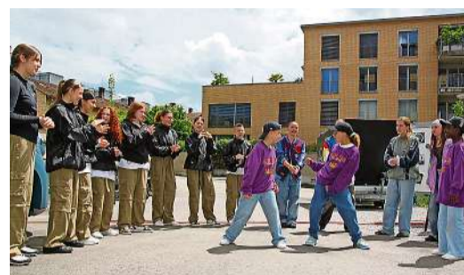
Die Tanzgruppe Kids beim Hip-Hop.