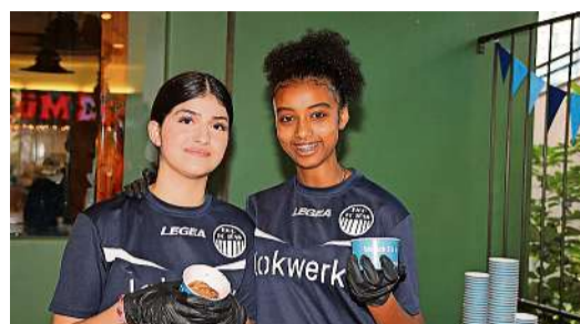
Shahi und Missli vom FC Töss beim Cupcake-Stand.