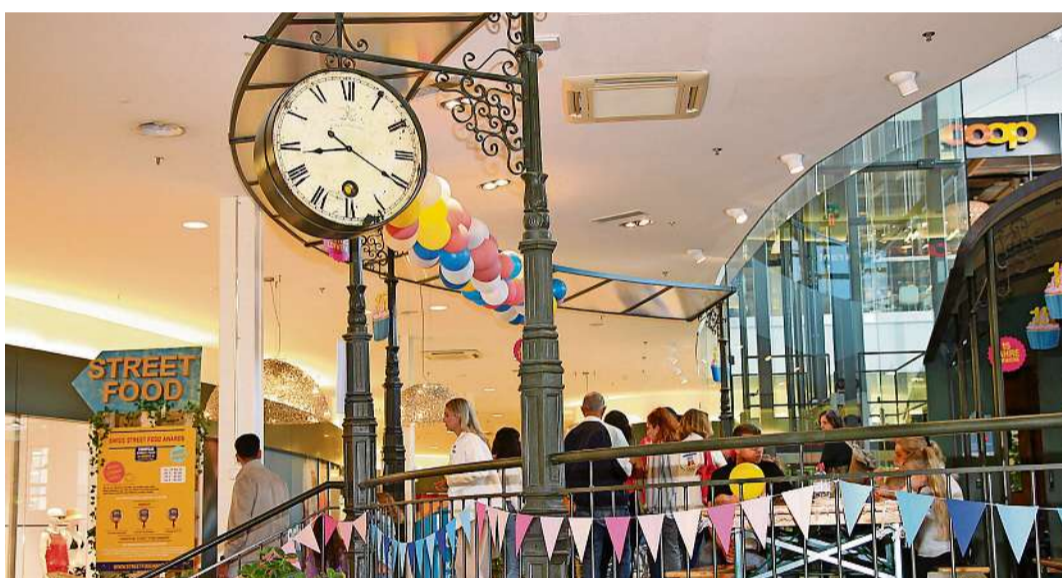
Das Publikum liess sich die Chance nicht entgehen, von den Aktivitäten zu profitieren.